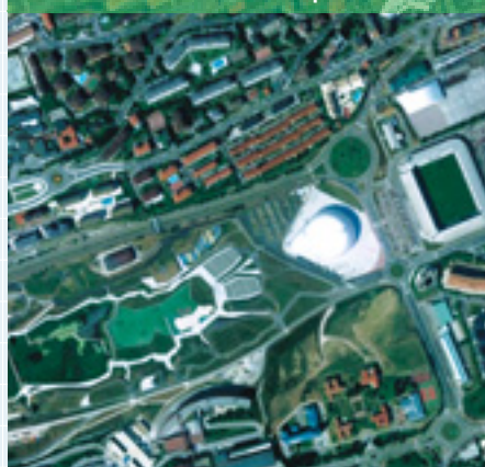
Cache 2. El barco pirata