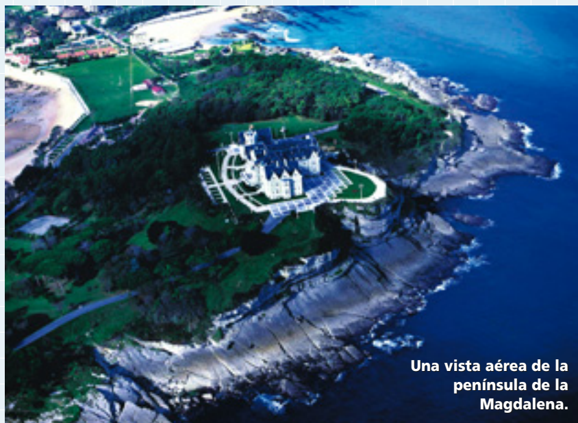
Una vista aérea de la península de la Magdalena.

Si ponemos rumbo hacia la costa y dejamos atrás las piedras históricas de la ciudad encontraremos lugares de excepción; primero las playas del Sardinero, la Primera y la Segunda, y después la minúscula de los Molinucos, un pequeño aporte de arena frente