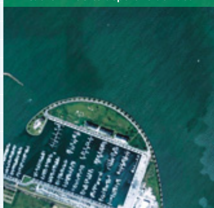
Cache 4. Puerto deportivo de Raos