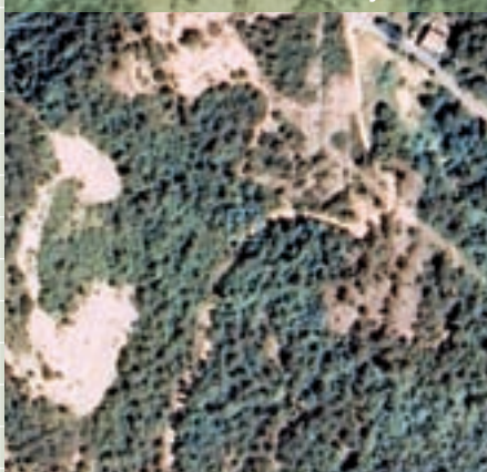
Caché 4. Roca del Lleó