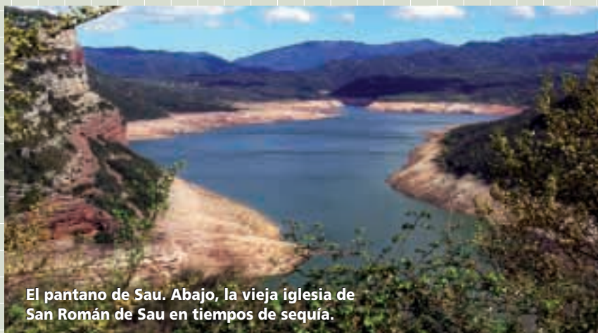
El pantano de Sau. Abajo, la vieja iglesia de San Román de Sau en tiempos de sequía.